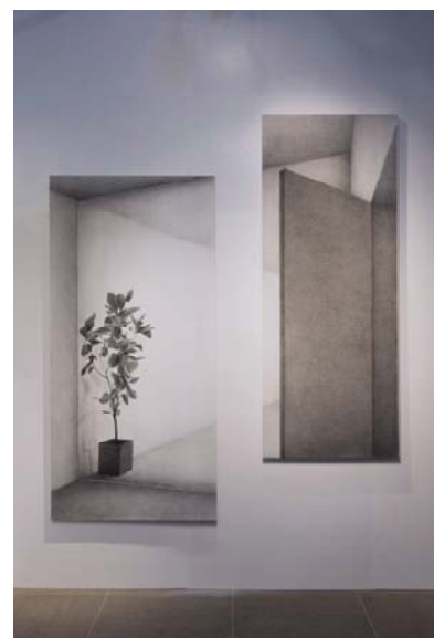
参考作品：「view」/2016年/墨、アクリル、鉛筆、紙 ※

今回は、会議室に人が集い、円形の空間であることを意識して取り組みます。この場で起こる会議と、壁に展開される絵が互いに呼応して、1つの風景が生まれるよう試みます。